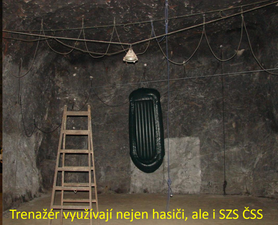
Trenažér využívají nejen hasiči, ale i SZS ČSS